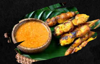
18 GAI SATEE 9,50 € RECOMMEND

Gegrillte Hähnchen-Spieße nach thailändische Art, dazu Erdnuss-Soße. (3Stück) Grilled chicken skewers Thai style, with peanut sauce.