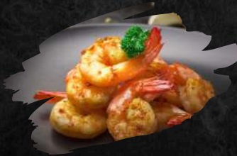
17 GUNG GRATIAM 12,90 €

Gebratene Garnelen mit geröstetem Knoblauch, dazu Chili-Soße. (6Stück) Fried shrimp with roasted garlic and chili sauce. (6pieces)