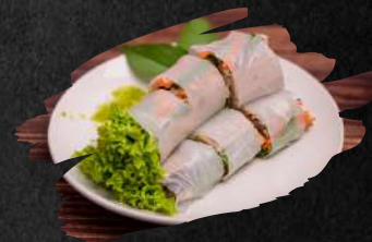
20 GUYTIEW LUI SURN 9,90 € NEW!

Reispapier gewickelt mit Salat, Hähnchen, Garnelen, Ingwer, Minze, rote Zwiebel, Erdnüsse und Koriander. Serviert mit Chili-Lemon Soße.(4 Stück)