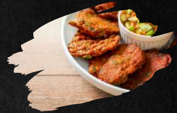
12 TORD MAN GAI 7,90 €

Hähnchen Frikadellen nach thailändischen Art. Dazu Chili Erdnuss Soße Thai style chicken meatballs. Plus chili peanut sauce