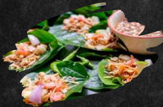
15 MIANG KAM 7,90 € RECOMMEND

Chaplo Blatt gewickelt mit Kokosraspel, Ingwer, Limetten, rote Zwiebel, Erdnüsse und getrocknete Shrimps. Serviert mit Palmsucker-Soße.(4 Stück)