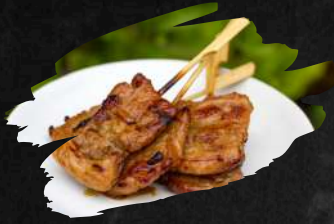
11 MUH PING 8,90 €

Gegrillte Schweinefleisch-Spieße. Dazu geröstete Chili-Soße.(3 Stück) Grilled pork skewers. With roasted chili sauce. (3 pieces)